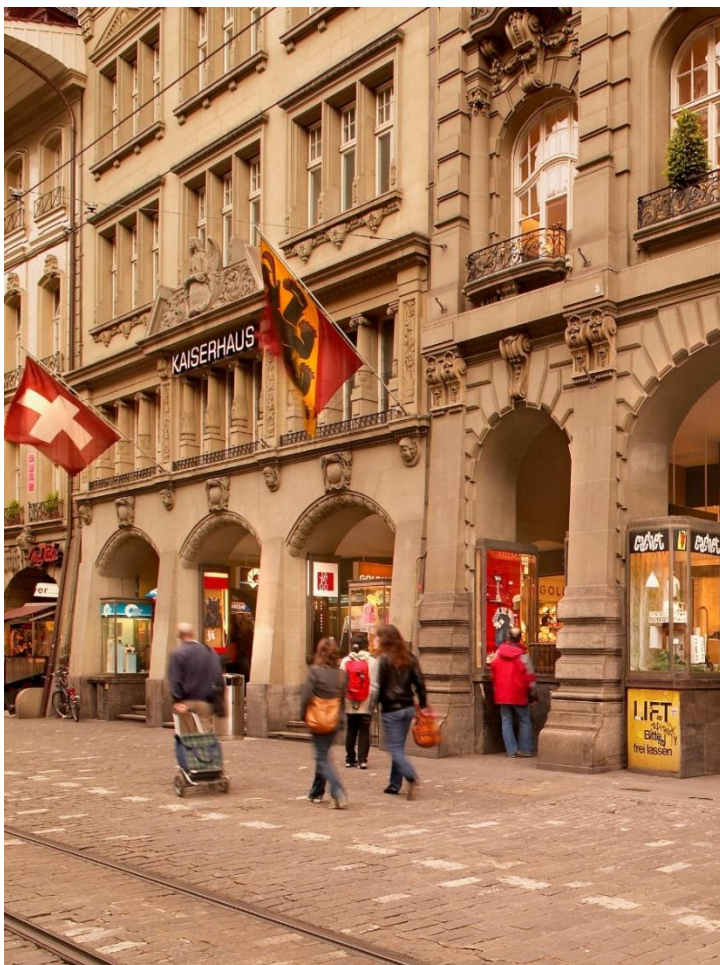
Abbildung 1: Berner Innenstadt

Der vorliegende Schlussbericht ist eine Kurzfassung der Analyse-, Workshop- und Befragungsergebnisse. Die ausführlichen Ergebnisberichte sind beim Wirtschaftsamt Bern verfügbar.