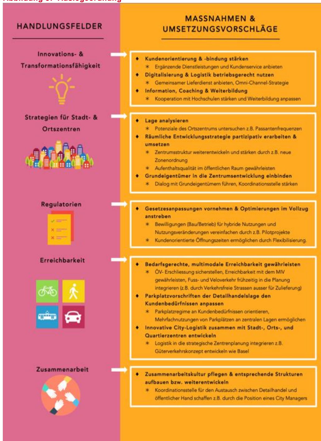
Abbildung 3: Auslegeordnung

Das Spektrum der Handlungsfelder und Massnahmen wurde schrittweise diskutiert, präzisiert und reduziert. Durch das gesammelte Feedback aus den Workshops und der Online-Umfrage konnten konkrete Massnahmen für den Detailhandel in der Innenstadt Bern erarbeitet werden (siehe Abb. 3). Die Online-Umfrage bot zudem die Möglichkeit, die Mitglieder des Begleitgremiums zu den aktuellen Auswirkungen der Corona-Krise zu befragen.